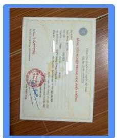
Ảnh bằng tốt nghiệp THPT (bản gốc)